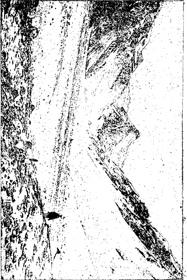
CALAVIERAS (Camino de Uspallata).