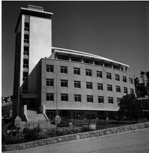
Edificio Escuela de Medicina Valparaíso, 1970.