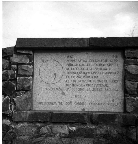
Edificio Escuela de Medicina, 1950.