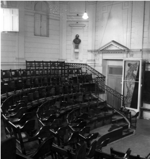
Auditorio, Escuela de Medicina, 1950.