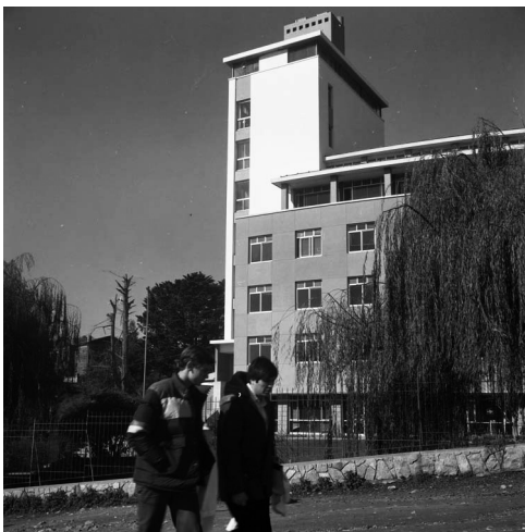
Edificio Escuela de Medicina Valparaíso, 1970.