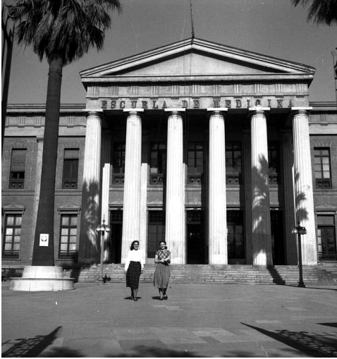
Edificio Escuela de Medicina, 1950.