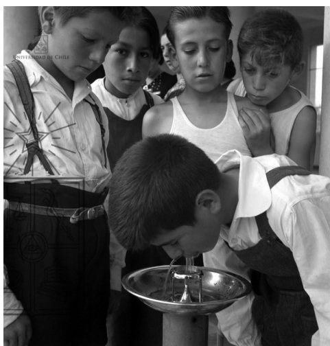
Fin del Recreo, 1960.