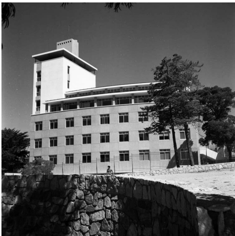
Edificio Escuela de Medicina Valparaíso, 1970. Colección Archivo Fotográfico, Subcolección Institucional.