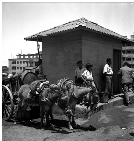
Distribución del agua potable en poblaciones, 1954.