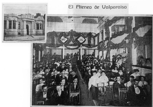
El Ateneo de Valparaíso

medias eran aún en Chile un sector sin una identidad política ni social propia: salvo excepciones, estaba “todo el tiempo huyendo de sí misma, tratando de incorporarse a la oligarquía. No pretendía transformarse en grupo alternativo a ella, aun cuando podía criticarla resentida, pero solapadamente” (Gazmuri 9 y 10).