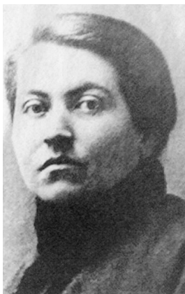
Gabriela Mistral hacia 1914. En Revista Ya, El Mercurio (15-12-1998).