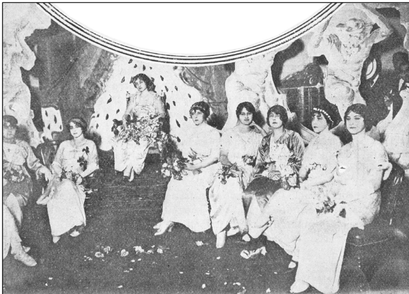
Corte de Amor de los Juegos Florales de 1914. En Zig-Zag 514 (26-12-1914).

realeza, elevado sobre altas escalinatas y salpicado de abundantes rosas naturales, según se aprecia en las fotografías. Alrededor de él, como “alas de luz y de gracia”, cual hadas 30 , las diez jóvenes aristócratas que componen la Corte de Amor. A la izquierda, los instrumentos musicales (piano y violín) y sus intérpretes. A la derecha, los cuatro poetas “vencedores en la justa florida” en el rubro poesía; junto a ellos, el Alcalde de Santiago y miembros de la SAECH. Ausente a la vista pública Gabriela Mistral, presencia anónima entre el público del anfiteatro o de la galería 31 .